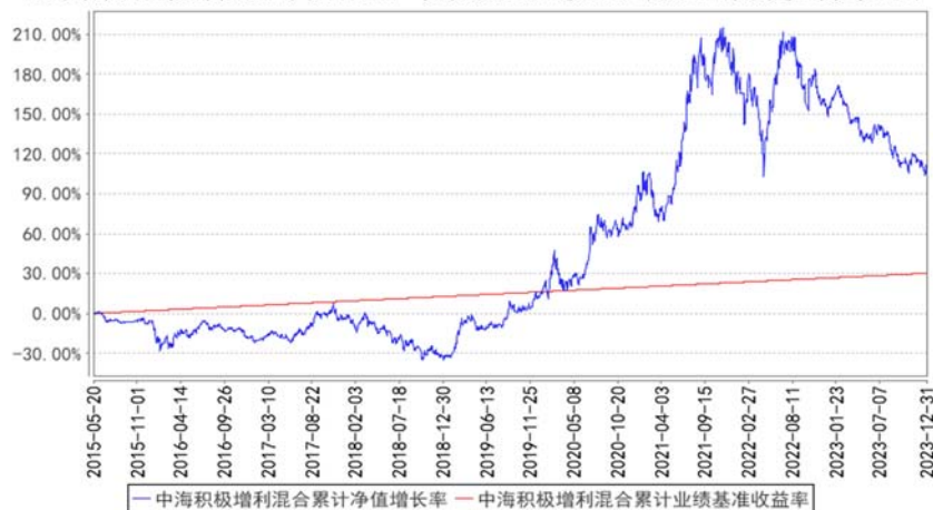
中海积极增利混合累计净值增长率与同期业绩比较基准收益率的历史走势对比图