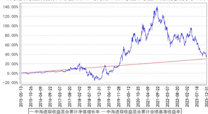
中海进取收益混合累计净值增长率与同期业绩比较基准收益率的历史走势对比图